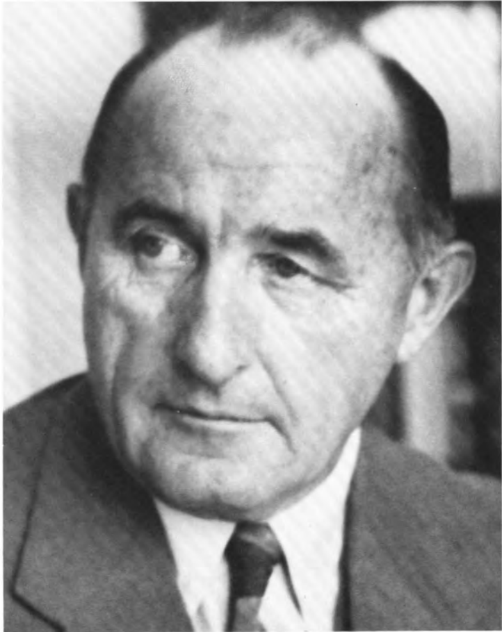
Carl L. Siegel