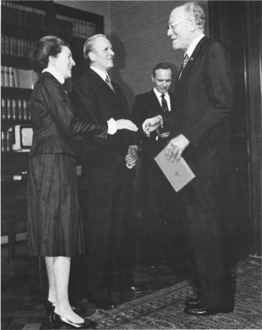
Neujahrsempfang beim Bundespräsidenten in der Villa Hammerschmidt in Bonn am 14. Januar 1982