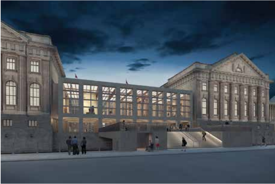
Abb. 5: Das Pergamonmuseum wird im Rahmen seiner Grundinstandsetzung einen neuen vierten Flügel erhalten. Damit sind künftig die monumentalen Architekturexponate Ägyptens, Vorderasiens, Griechenlands, Roms und des islamischen Kulturraumes in einem einzigartigen Rundgang erlebbar.

auch um einen Ort, der die Museumsinsel in das 21. Jahrhundert weiterentwickelt. Die architektonische Form ist von David Chipperfield insofern sehr klug gewählt, weil sie das Motiv der Stülerischen Kolonnade südlich des Neuen Museums in westlicher Richtung fortführt, dabei jedoch in eine moderne Formensprache übersetzt. Der Hauptzugang erfolgt von der Bodestraße her über eine breite, großzügige und einladende Treppe, die in das Hauptgeschoß hinaufführt und dabei das Motiv der Freitreppe von Schinkels Altem Museum aufgreift und ebenfalls zeitgemäß umsetzt.