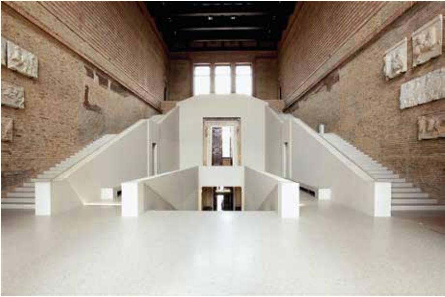
Abb. 3: Davd Chipperfields Wiederherstellung des Neuen Museums erhielt zahlreiche Preise.

seine Wirkung läßt, gleichzeitig Neues in geeigneter Form hinzufügt und damit auch die Spuren der jüngeren deutschen Geschichte sichtbar macht. (Abb. 3)