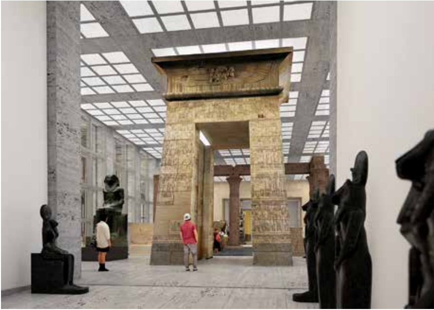
Abb. 6: Eines der Highlights im vierten Flügel des Pergamonmuseums wird das ägyptische Kalabscha-Tor sein.

Die Hauptebene wird also einen grandiosen Rundgang durch die Architekturgeschichte der Antike bieten, beginnend mit dem pharaonischen Ägypten und mit Mesopotamien und über die griechisch-römische Welt bis in den frühen Islam reichend. Dabei werden auch Verbindungen zwischen Epochen und Kulturräumen deutlich. Der Besucher wird verstehen, daß die griechisch-römische Welt nicht ohne ihre ägyptischen und vorderasiatischen Wurzeln zu verstehen ist, und er wird auch begreifen, wie sehr die Kunst des Islam auf antikem Erbe aufbaut. In den Nebenräumen des Hauptrundgangs sowie im Obergeschoß werden dann die übrigen Sammlungsbestände des Vorderasiatischen Museums im Südflügel und des Museums für Islamische Kunst im Nordflügel zu sehen sein. Der Mittelteil wird – wie bisher – durch die Architekturdenkmäler der Antikensammlung bestimmt, während der neue vierte Flügel am Kupfergraben