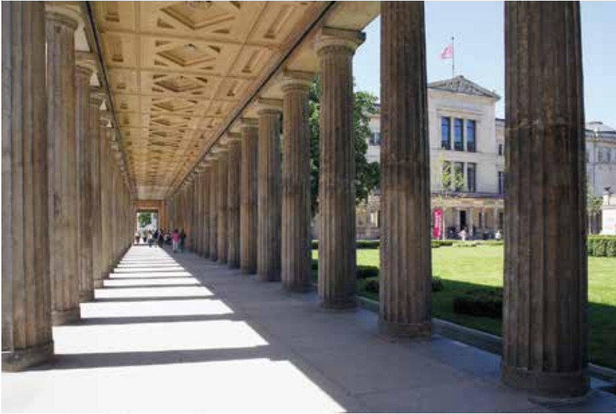
Abb. 8: Der Kolonnadenhof zwischen Neuem Museum und Alter Nationalgalerie – ein Ort zum Verweilen.

Studiensammlungen, Restaurierungslabors, Räume der Fachwissenschaftler und andere Bereiche, die hier in einer modernen Wissenschaftsinfrastruktur zusammengefaßt sind. In einem Lesesaal und in einen Saal für Sondersammlungen sind die Bibliotheks- und Sammlungsbestände der Museen zu Studienzwecken nun der internationalen Forschung und dem universitären Nachwuchs umfassend zugänglich. Das Archäologische Zentrum ist gleichzeitig auch der topographische Brückenschlag von der Museumsinsel hinüber zur Humboldt-Universität.