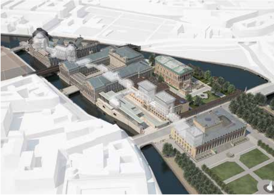
Abb. 7: Die Archäologische Promenade wird vier der fünf Museumsbauten verbinden und sammlungsübergreifend die großen Themen der Kulturgeschichte präsentieren.

dem Jenseits, ob mit dem Themenkreis Ornament und Abstraktion oder ob mit der Kunst des Erinnerns. Diese Themen sollen künftig mit Objektbeispielen aus verschiedenen Kulturen und Epochen in der Archäologischen Promenade als langgestrecktem, die Häuser verbindendem Ausstellungsraum behandelt werden. Dieser Ansatz ist um so wichtiger, weil die einzelnen Gebäude der Insel – und das zeichnet sie gerade aus und unterscheidet sie gleichzeitig von anderen großen Museumskomplexen der Welt – ja auf ganz bestimmte Kulturräume, Epochen und Kunstgattungen fokussiert sind. Die Archäologische Promenade wird damit die Häuser der Insel auf eine intellektuell besonders ansprechende Weise verknüpfen.