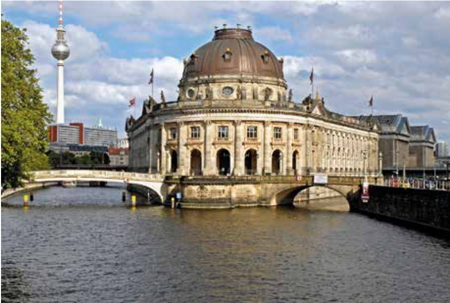
Abb. 2: Das Bode-Museum an der Nordspitze der Museumsinsel Berlin wurde als zweites Haus nach der Alten Nationalgalerie saniert und 2006 wiedereröffnet.

an vor Bombenangriffen sichere Orte außerhalb Berlins verlagert wurden.