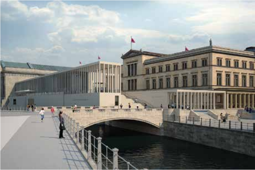
Abb. 4: Die James-Simon-Galerie wird Besucher ab 2019 mit großer Geste begrüßen und entscheidende Servicefunktionen für einen zukunftsfähigen Museumskomplex übernehmen.

dische Anbindung an die Archäologische Promenade mit Zugang zu vier der fünf Museen auf der Insel sowie entsprechende Kapazitäten für Ticketing, Garderobe, Shops und Gastronomie, damit der Besucher auch Orte zum Verweilen und Ausruhen vorfindet.