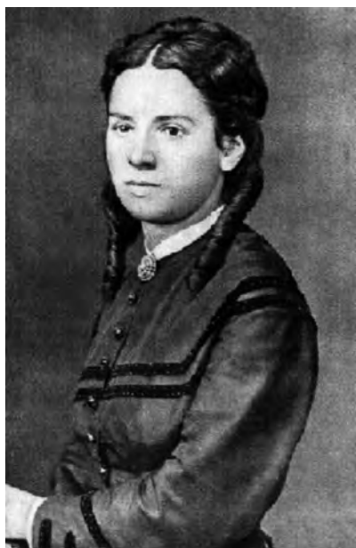
Abb. 6: Jenny Marx